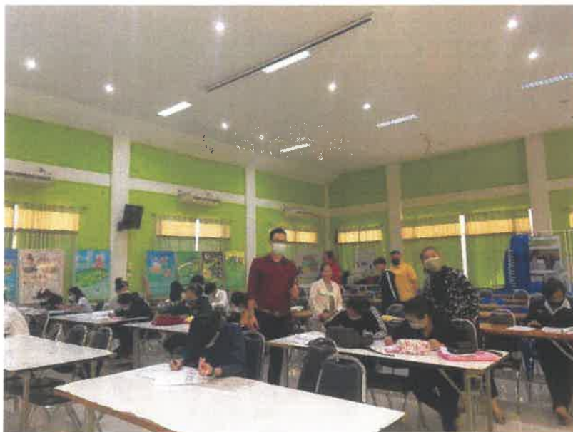
ภาพแสดง กิจกรรมปฐมนิเทศเพื่อสร้างความเข้าใจร่วมกันระหว่างคณาจารย์ และเจ้าหน้าที่โครงการU2T AM