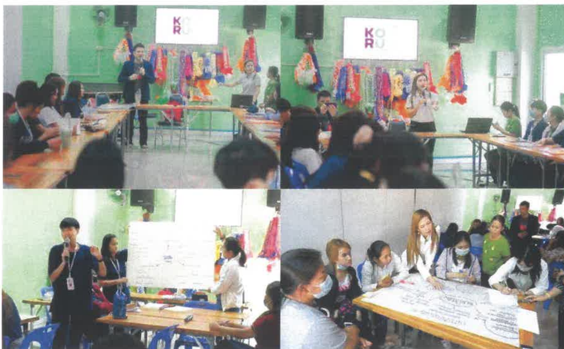
ภาพแสดง กิจกรรมการเสริมสมรรถนะเจ้าหน้าที่ U2T ในการทำเครื่องมือชุมชนและการสังเคราะห์ข้อมูล โดยมีเครือข่ายตำบลอื่นเข้าร่วมทั้งอาจารย์ เจ้าหน้าที่ U2T ตัวแทนชุมชน ถ่ายทอดความรู้โดยคณาจารย์คณะฯ