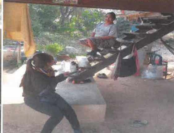
ภาพแสดงกิจกรรม การลงพื้นที่ทวนสอบข้อมูลหมู่บ้าน และศึกษาชุมชน สร้างความคุ้นเคย และหาเครือข่ายนักวิจัยชุมชนในการดำเนินโครงการ