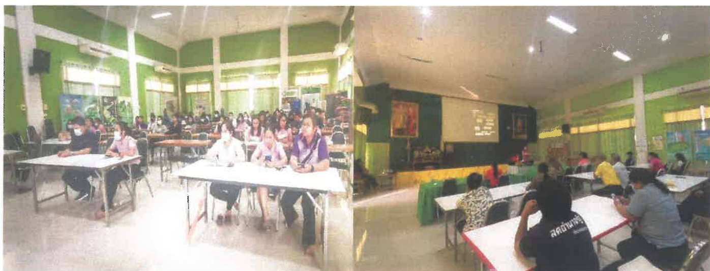
ภาพแสดงกิจกรรมร่วมประชุมระดับท้องถิ่น “สภาพต.” แนะนำเจ้าหน้าที่และภารกิจ U2T และภารกิจ