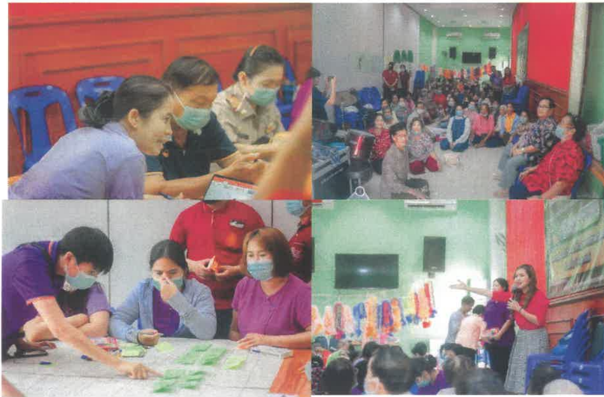
ภาพแสดงการร่วมบูรณาการดำเนินการโครงการของนักศึกษาสหกิจ อาสาพระราชรัฏฐ