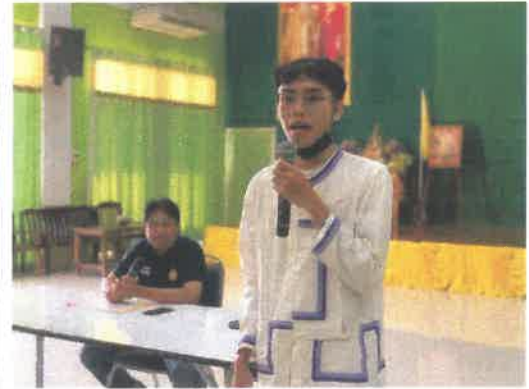
ภาพแสดงกิจกรรม กิจกรรมเปิดตัว สร้างความเข้าใจผู้นำระดับท้องถิ่น ประชาชน ชุมชน ตัวแทนกลุ่มองค์กร