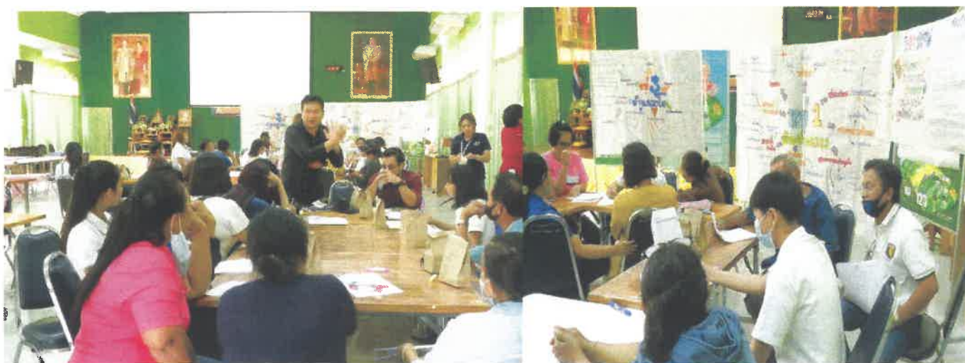
ภาพแสดง กิจกรรมเวทีการทวนสอบข้อมูล U2T โดยมีเครือข่ายตำบลอื่นเข้าร่วมทั้งอาจารย์ เจ้าหน้าที่ U2T ตัวแทนชุมชน