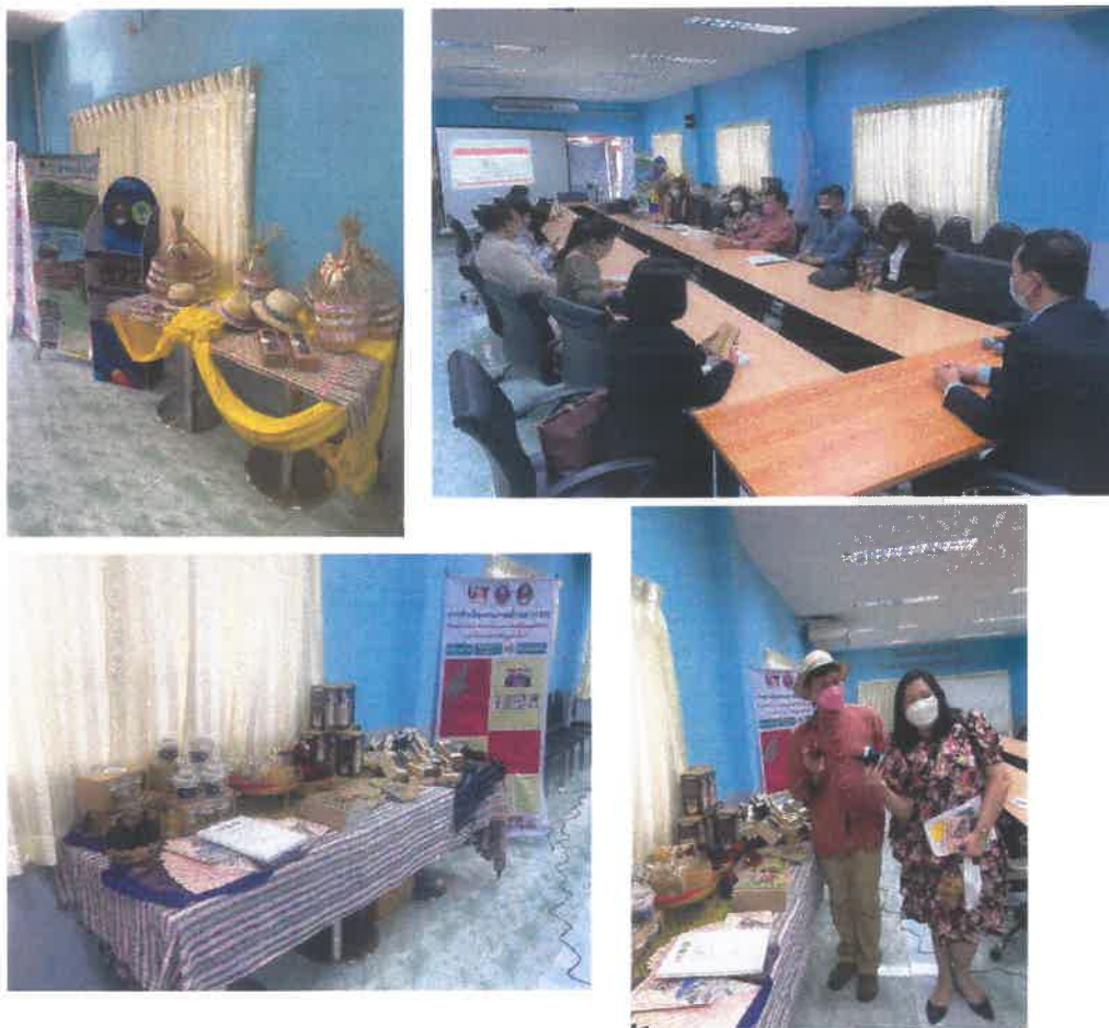
ภาพแสดงกิจกรรมการจัดนิทรรศการและแลกเปลี่ยนผลการดำเนินงานโครงการ U2T เฟส 1 เพื่อเชิญชวนผู้สนใจเข้าร่วมโครงการในเฟสที่ 2 และกิจกรรมการจัดนิทรรศการเผยแพร่ความรู้ผลการดำเนินการที่ได้แก่บุคคลทั่วไป