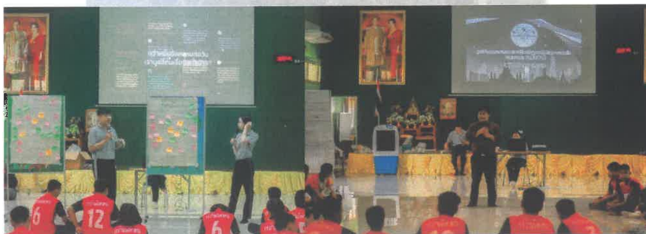
ภาพแสดงกิจกรรมร่วมดำเนินการโครงการบูรณาการวิจัยและบริการวิชาการ คณะมนุษยศาสตร์ฯ คณะครุศาสตร์ คณะวิทยาการจัดการ