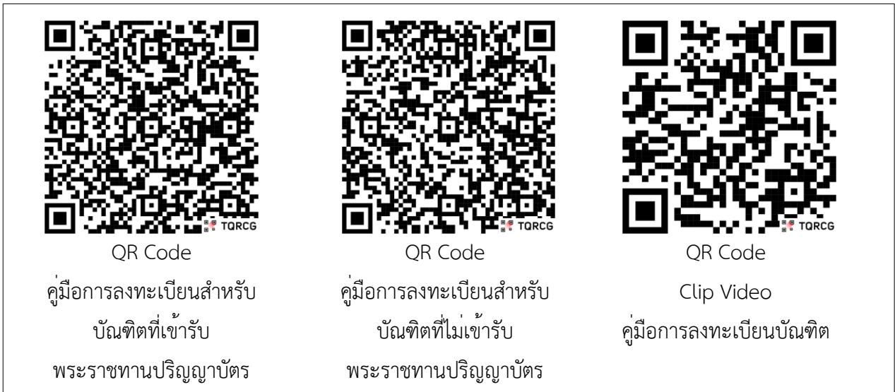
ภาพที่ 2 แสดง QR Code คู่มือการลงทะเบียนบัณฑิต